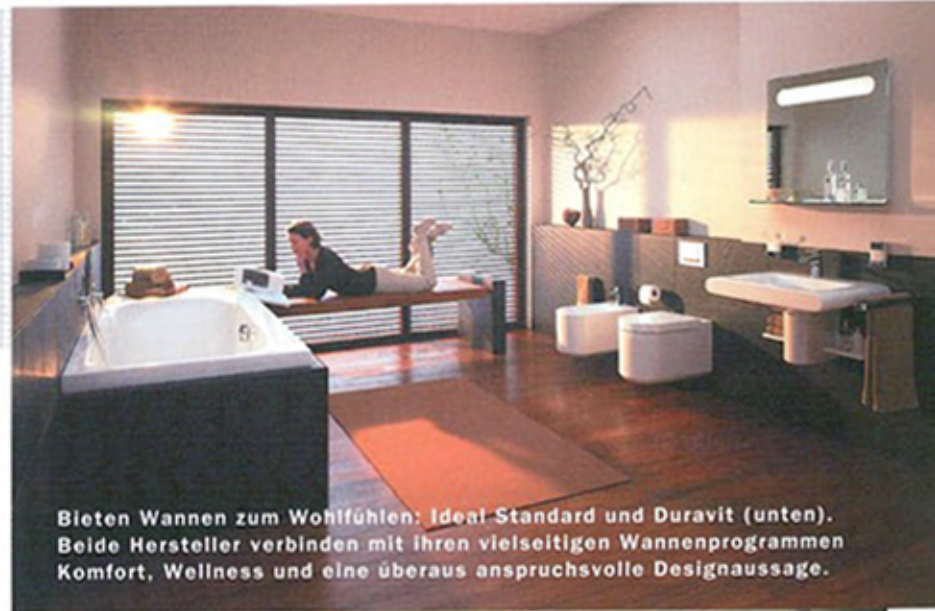
Bieten Wannen zum Wohlfühlen: Ideal Standard und Duravit (unten). Beide Hersteller verbinden mit ihren vielseitigen Wannenprogrammen Komfort, Wellness und eine überaus anspruchsvolle Designaussage.

FÜNF TAGE lang (6. bis 10. März) dreht sich in Frankfurt alles um Wasser, Wärme und Luft. Die ISH, Weltleitmesse Bad, Gebäude-, Energie-, Klimatechnik, Erneuerbare Energien, bildet die Innovationskraft einer Branche ab, die sich im Aufwind befindet. Schließlich ist der Renovierungsbedarf gerade in Sachen Nasszelle so hoch wie noch nie in Deutschland. Und auch das Thema Wellness mit all seinen relaxenden und erfrischenden Facetten ist beim Verbraucher nach wie vor angesagt. Erwartet werden in Frankfurt 2300 Aussteller aus aller Welt, die auf 250.000 Quadratmeter ihre Neuheiten präsentieren. Die Stärke der ISH, ihr konsequentes Verbundsystem, kann dabei auf dem gesamten Gelände ausgespielt werden. Besonders fresh wird es diesmal in der Erlebniswelt Bad zugehen. In den Hallen 1, 3, 4 sowie im Forum und in der Festhalle wird Wasser in seiner schönsten Form inszeniert.